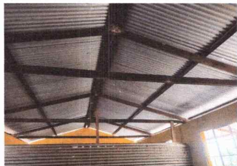
Foto 2: Sustitucion de estructura de soporte de madera por metal.