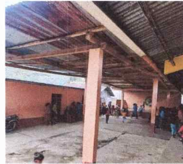
Foto 4: Sustitucion de estructura de soporte de madera por metal.