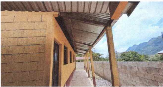
Foto1: Sustitucion de laminas por laminas troqueladas